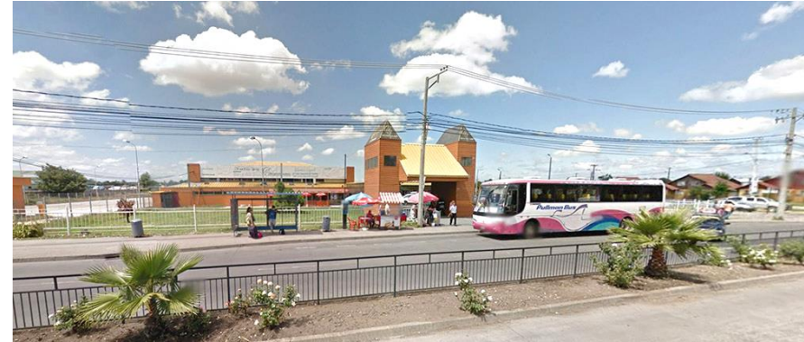
Terminal Santa María Los Ángeles

Para más información, descarga la aplicación: https://moovitapp.com/los_angeles_chile