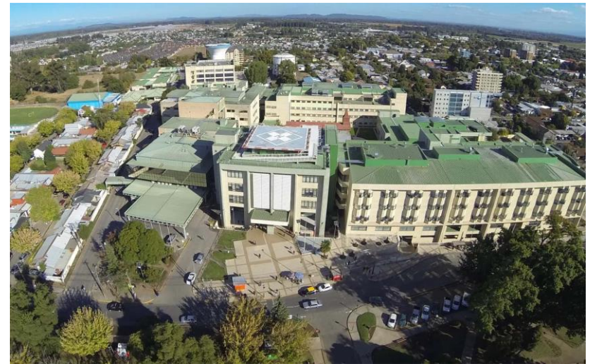
Hospital de Los Ángeles