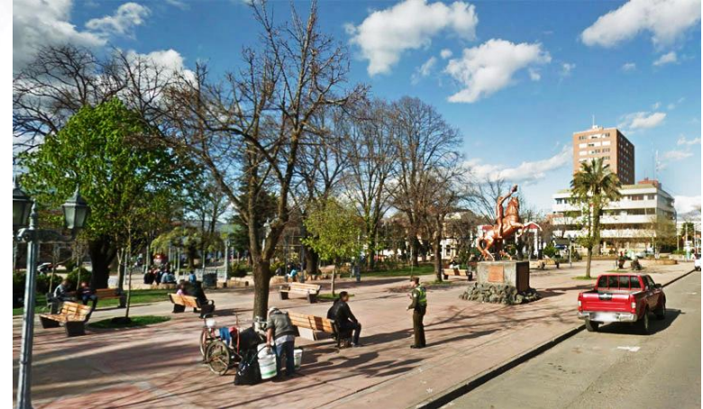
Centro de Los Ángeles

De climas extremos, Los Ángeles es en la actualidad el mayor centro de servicios culturales, turísticos, comerciales, financieros, productivos, educacionales y de salud en la provincia , y cuenta con muchos lugares por visitar.