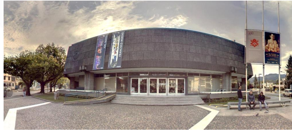
Pinacoteca ("Casa del Arte UdeC")