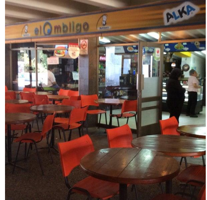
Cafetería El Ombligo