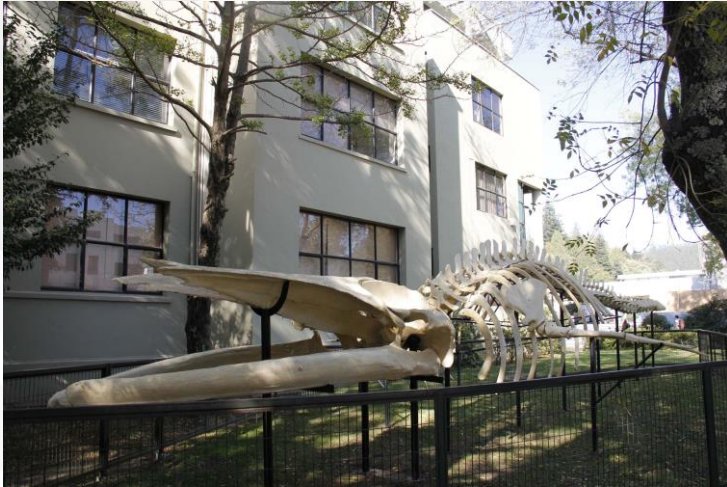
Facultad Cs. Naturales y Oceanográficas (La "ballena")