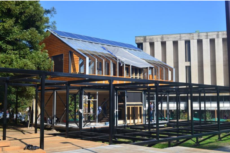
Casa Solar (oficinas CADE)