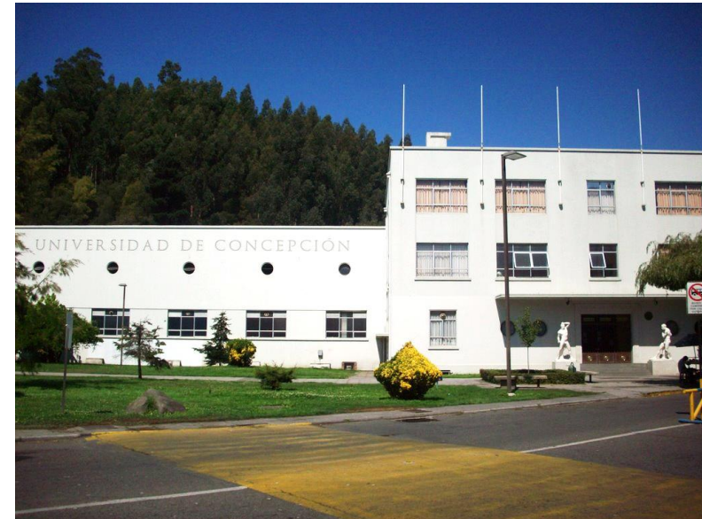
Casa del Deporte UdeC