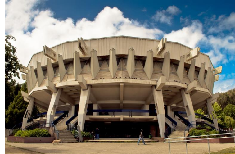
Plato (Edificio de aulas Salvador Gálvez)